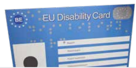
European Disability Card p. 3