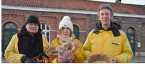
N-VA in actie p. 2